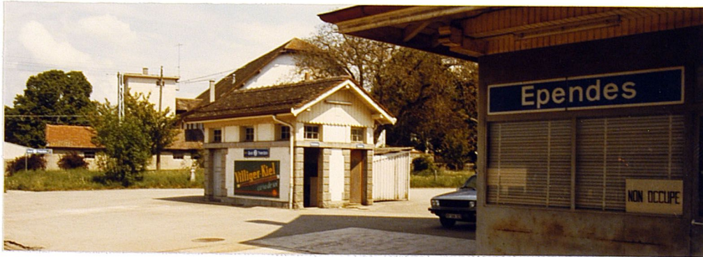
WI E-L 3