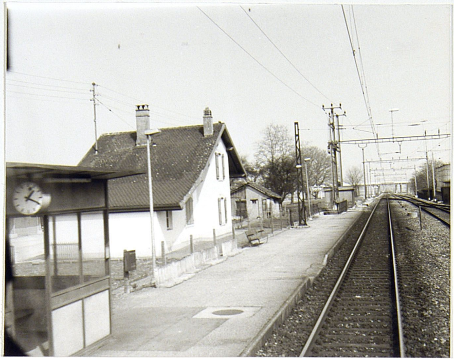
+ 10-37 A