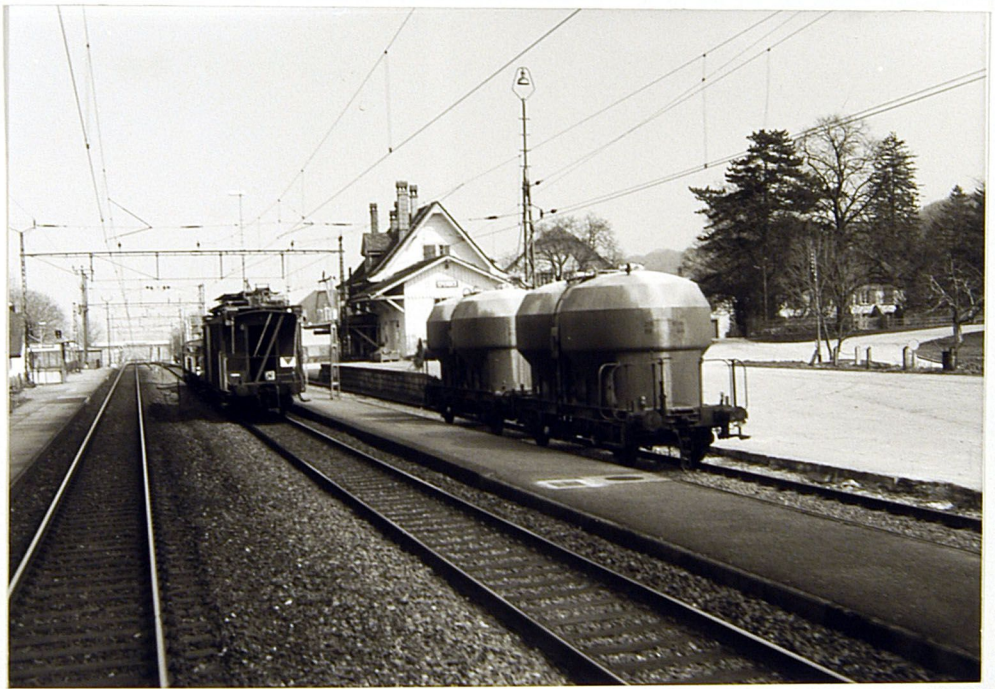
+ 10-36 A