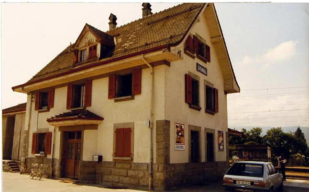
WI E-L 3