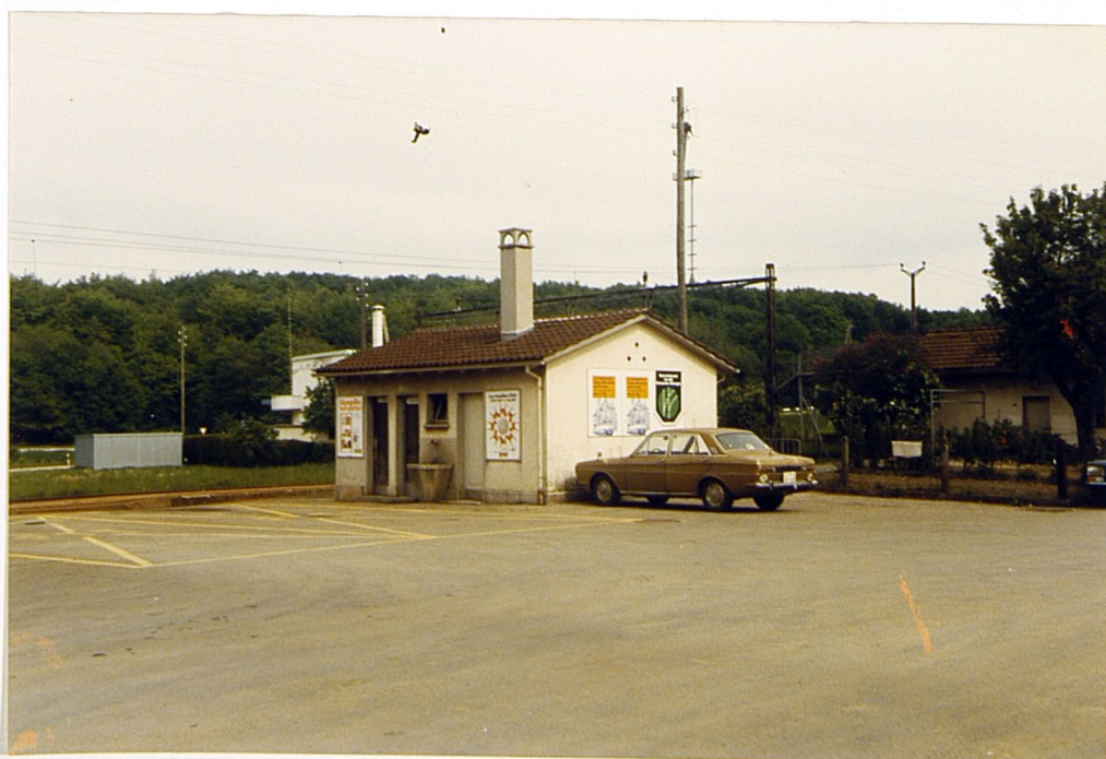
WI C-D 109