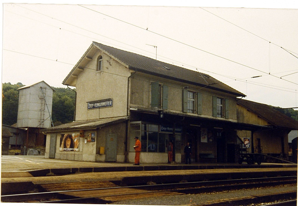
WI C-D 109